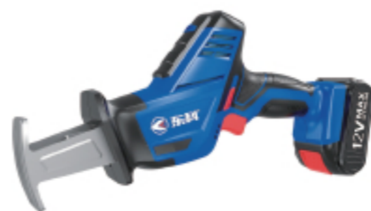
G1213-15 锂电往复锯(MRS12) Lithium reciprocating saw