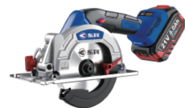
KBL2111-140 无刷锂电圆锯 Brushless lithium circular saw