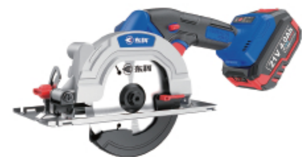
KBL2111-125 无刷锂电圆锯(KCS125) Brushless lithium circular saw