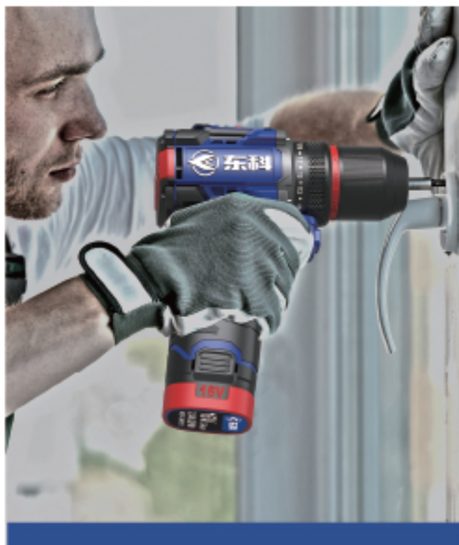
DGT01-1610B/13B 无刷双速锂电钻 Brushless 2-speed lithium drill