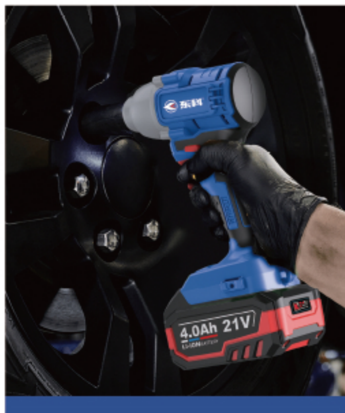
KBL2103-300 无刷锂电冲击扳手(AK47-2) Brushless lithium impact wrench