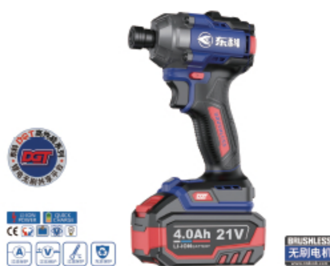
DGT2105-260 无刷锂电冲击起子机 Brushless lithium impact screwdriver