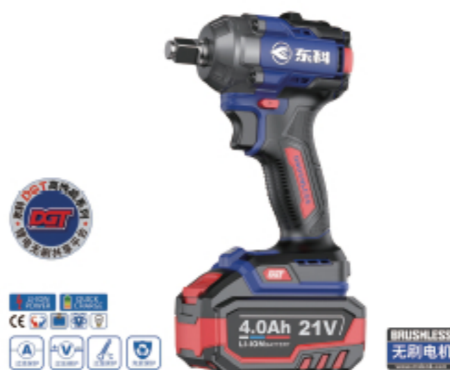
DGT2103-350C 无刷锂电冲击扳手 Brushless lithium impact wrench