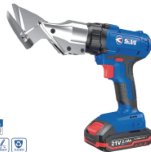
K2112-35A 锂电剪刀(MTBJ21-AK) Lithium electric scissors