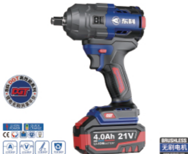
DGT2103-1000 无刷锂电冲击扳手 Brushless lithium impact wrench