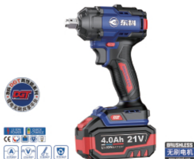
DGT2103-500B 无刷锂电冲击扳手 Brushless lithium impact wrench