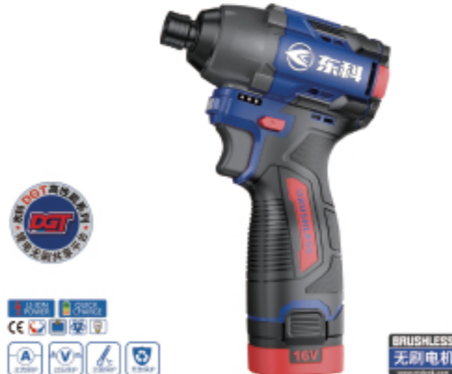
DGT1605-140 无刷锂电冲击起子机 Brushless lithium impact screwdriver