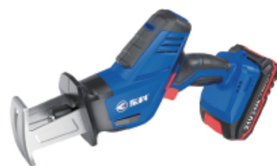
K2113-15A 锂电往复锯(MRS21-AK) Lithium reciprocating saw