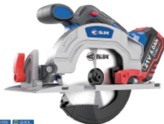
KBL2111-165 无刷锂电圆锯(KCS165) Brushless lithium circular saw